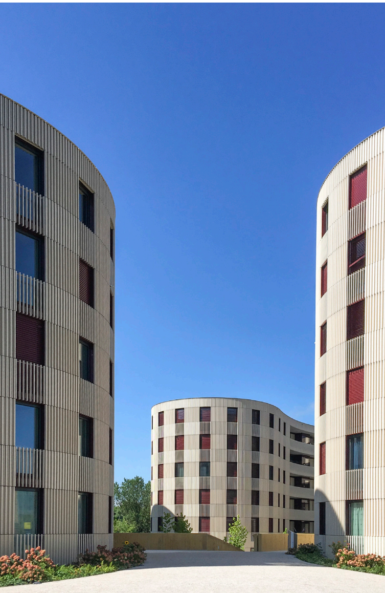
Studentischer Wohnraum, ETH Zürich, Hönggerberg