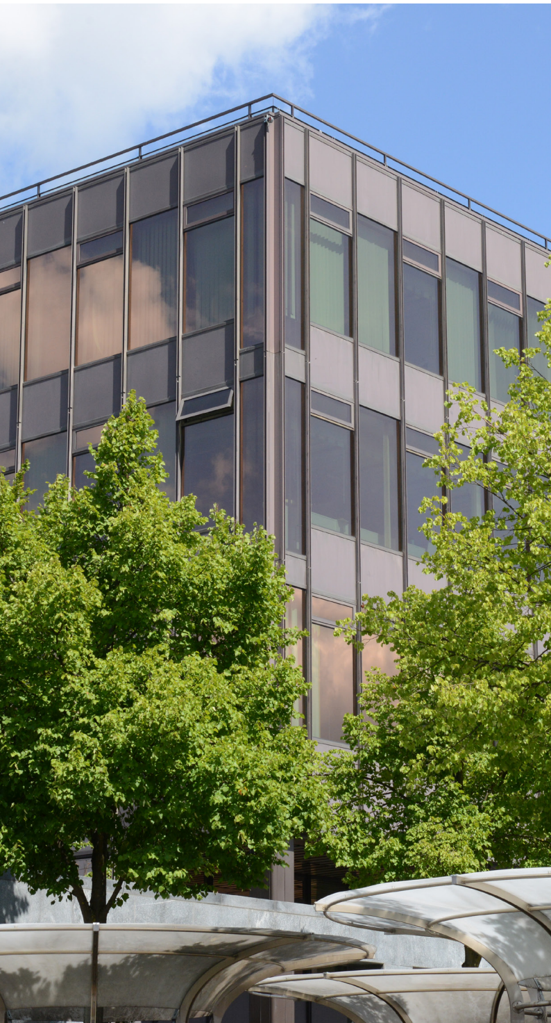
Gebäude HIL, ETH Zürich, Höggerberg