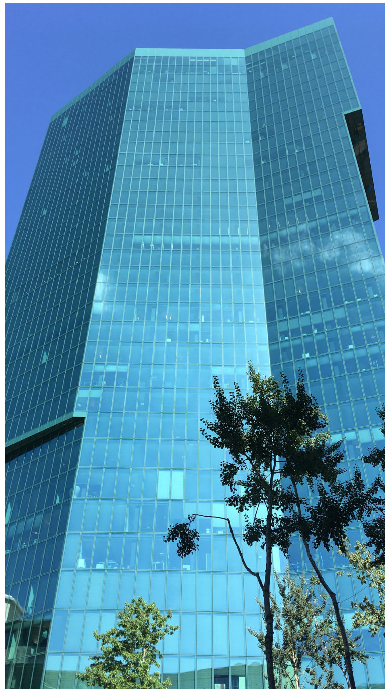
ETH e-Science Lab, HIT, ETH Zürich, Höggerberg Text: Baumschlager Eberle Architekten. www.baumschlager-eberle.com .

Als architektonisch interessanter Zeuge der Industriegeschichte des Ortes, der ehemaligen Zahnradfabrik, konnte das Diagonal-Gebäude erhalten bleiben. Die Tragkonstruktion und die Fassaden wurden sorgfältig saniert. Die noch bestehenden feinen Glasprofile wurden instand gesetzt und durch innere isolierende Verglasungen ergänzt. Das Diagonal enthält ein Restaurant im Erdgeschoss und Ausstellungsräume in den Obergeschossen.