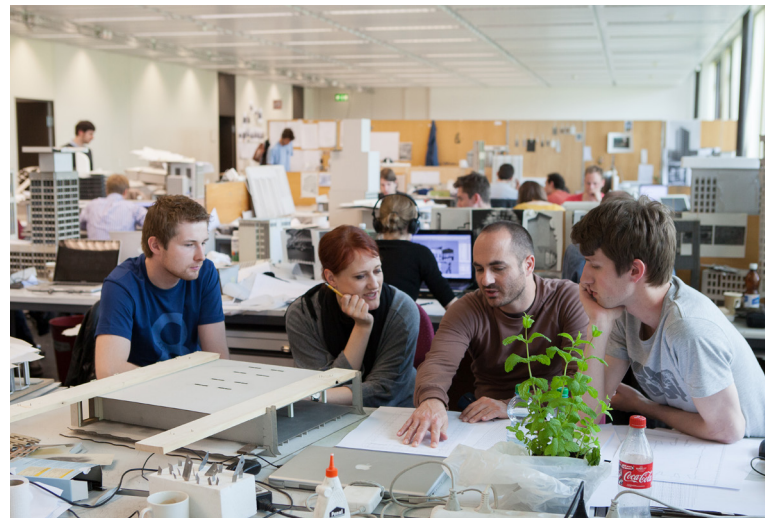
Entwurfsunterricht im Zeichensaal

Zur Ergänzung des Studiums müssen praktische Tätigkeiten im Bereich Architektur ausgeübt werden, das heisst in Projektie-